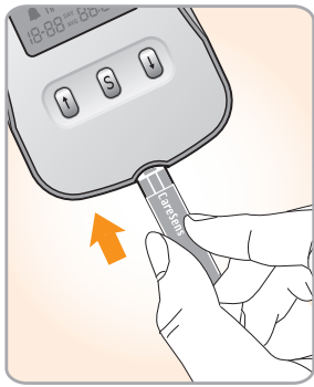
1 Aseta testiliuska