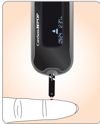
2 Lisää verinäyte