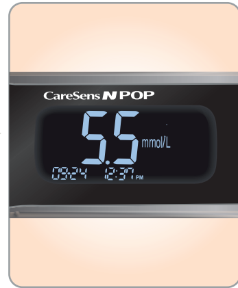
3 Tulos on luettavissa 5 sekunnissa valaistulta näytöltä