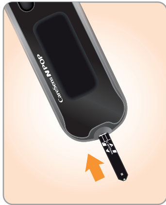
1 Aseta testiliuska